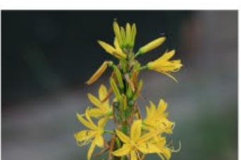
V.71 Aspedelina lutea zon, h 70, bl 5-7