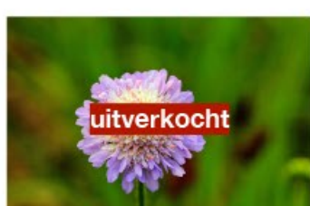
V.3 Knautia arvensis zon, h 100, bl 6-9