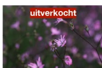
V.15 Lychnis flos-cuculi zon/hs, h 90, bl 5-8