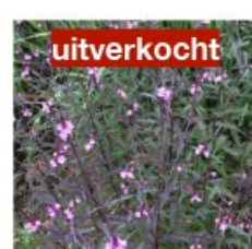
V.54 Verbena off. Bampton zon, h 80, bl 7-10