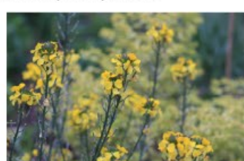
V.90 Erysimum Bowles Yellow zon/hs, h 30, bl 4-10