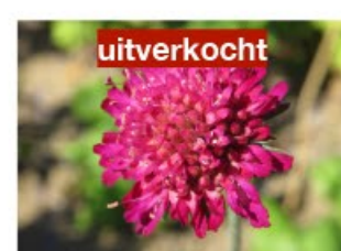
V.52 Knautia macedonica zon, h 90, bl 7-8