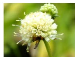
V.82 Succisa prat. Buttermilk zon/hs, h 50, bl 7-9