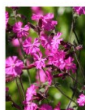
V.6 Silene dioica zon/hs, h 50, bl 5-10