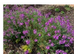
V.53 Erysimum bowles mauve zon, h 60, bl 5-9