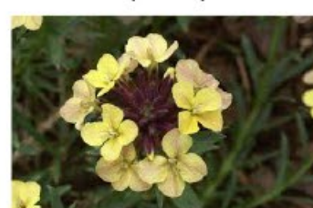
V.7 Erysimum J. Codrington zon, h 25, bl 4-8