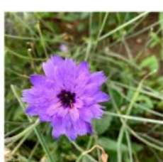
V.56 Catananche caerulea zon/hs, h 70, bl 7-9