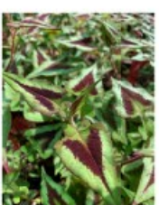
V.61 Persicaria purpl. fantasy zon/hs, h 80, bl 8-10