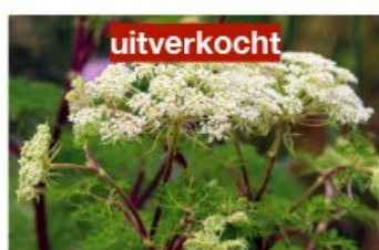
V.73 Selinum wallichianum zon/hs, h 100, bl 7-9