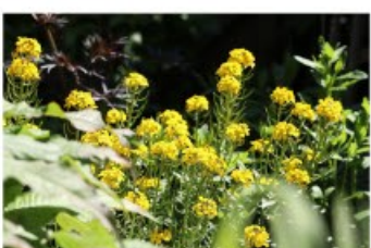
V.81 Muurbloem heldergeel zon/hs, h 30, bl 4-5