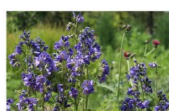
V.4 Jakobs ladder zon/hs, h 100, bl 6-8