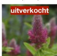
V.64 Trifolium rubens zon/hs, h 50, bl 4-5