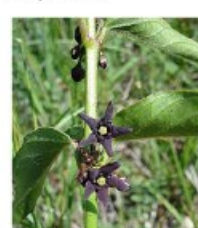
V.91 Vincetoxicum nigrum zon/hs, h 150, bl 6-7