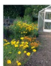
V.57 Coreopsis Grandiflora zon, h 60, bl 5-9