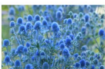
V.29 Eryngium Blauer Zwerg zon, h 100, bl 7-8