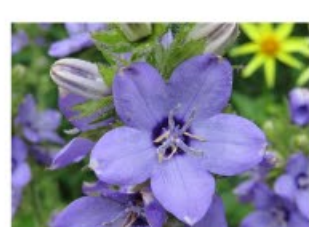
V.2 Campanula primulifolia zon/hs, h 60, bl 6-7