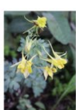
V.48 Akelei Denver Gold zon/hs, h 80, bl 5-7