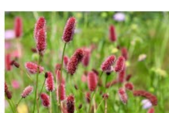
V.88 Sanguisorba menziessi zon, h 80, bl 5-7