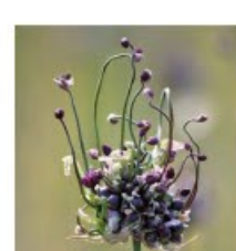
Allium scorado prosum art zon/hs, h 100, bl 6-7