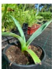
V. 80 Agave div prijzen