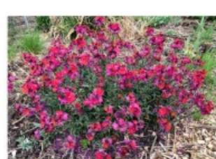
V.87 Erysimum zon/hs, h 30, bl 4-6