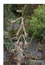
V.16 Silene friwaldskyana zon/hs, h 70, bl 6-8