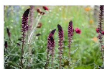
V.1 Rode wederik zon/hs, h 80, bl 5-9