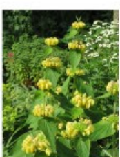
V.70 Phlomis russelliana zon/hs, h 70, bl 5-7