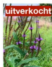
V.66 Verbena hastata blue spire zon, h 100, bl 7-9