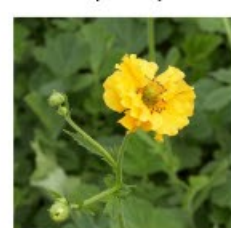
V.60 Geum Lady Stratheden zon/hs, h 50, bl 5-6