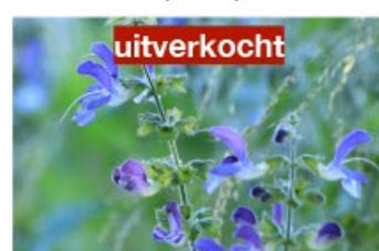
V.35 Salvia Forskaohlei zon/hs, h 70, bl 7-9