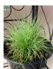
V.18 Festuca glauca amigold zon/hs, h 20, bl -