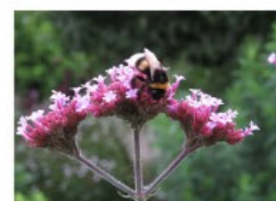
V.65 Verbena bonariensis zon, h 180, bl 8-10