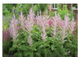
V.45 scl. Turkestanica zon/hs, h 75, bl 6-7