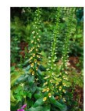
V.64 Digitalis nervosa zon/hs, h 80, bl 6-7