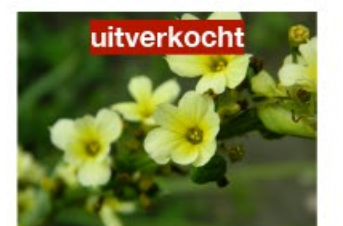
V.85 Sisyrinchium striatum Zon/hs, h 40, bl 4-6