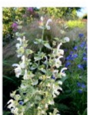
V.79 Salvia scl. Vatican White zon/hs, h 75, bl 6-7