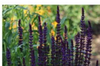
V.34 Salvia Caradonna zon/hs, h 70, bl 6-8