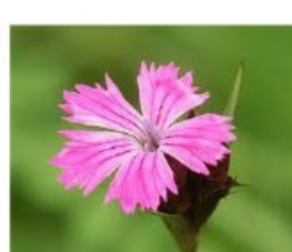
V.13 Dianthus carthusianorum zon, h 30, bl 6-8