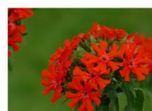
V.22 Brandende liefde zon, 100, bl 7-8