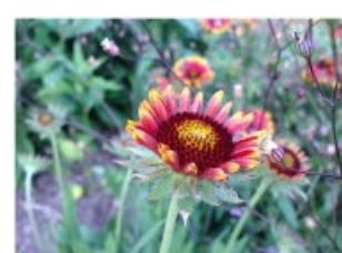
V.58 Gaillardia grandiflora zon, h 80, bl 6-9