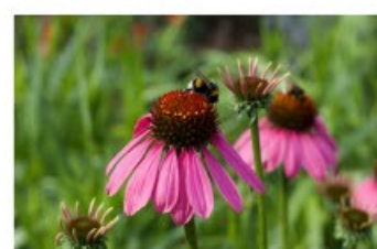
V.83 Echinacea purpurea zon/hs, h 100, bl 7-9