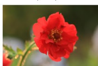
V.23 Geum mrs Bradshaw zon/hs, h 50, bl 5-7