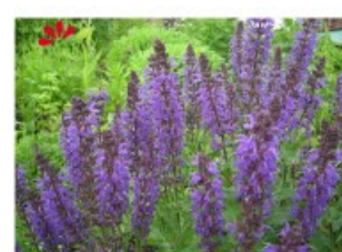
V.33 Salvia Blaukoningin zon/hs, h 40, bl 6-8