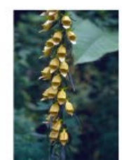
V.63 Digitalis laevigata zon/hs, h 80, bl 6-7