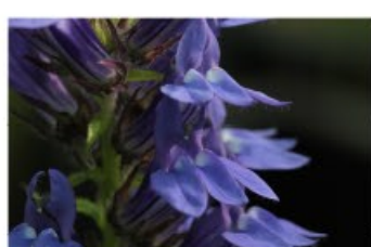
V.39 Lobelia syphilitica zon/hs, h 60, bl 7-9