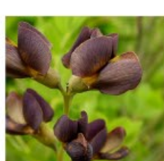
V. 86 Baptisia Dutch Chocolat zon/hs, h 80, bl 6-7