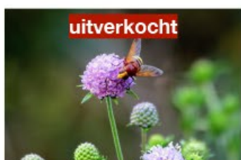
V.74 Succisa pratensis zon, h 80, bl 6-9