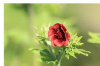
V.70 Potentilla Monarch's velvet zon, h 60, bl 7-8