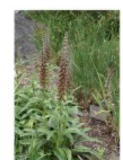
V.62 Digitalis parviflora zon/hs, h 50, bl 6-7