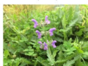
V.60 Salvia verbenacae zon/hs, h 40, bl 6-8