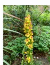
V.77 Zwarte toorts zon/hs, h 150, bl 6-8