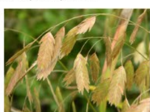
V.89 Chasmanthium latifolium zon/hs, h 80, bl 8-9